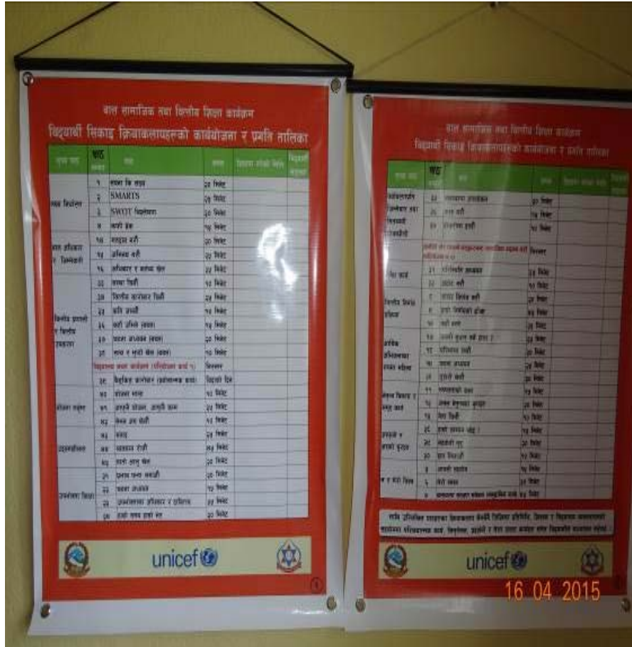
Teachers activity workplan